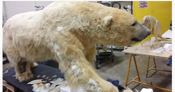
INSECTES DES MUSÉES