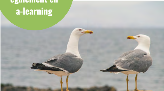
MOUETTES & GOELANDS

Certaines disponibles également en a-learning