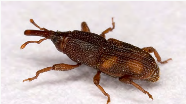
INSECTES DES DENRÉES STOCKÉES